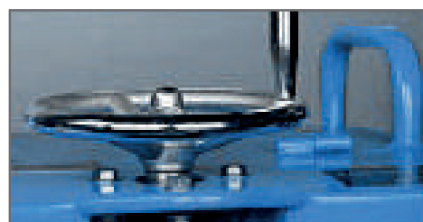
Sistema di controllo profondità a volantino